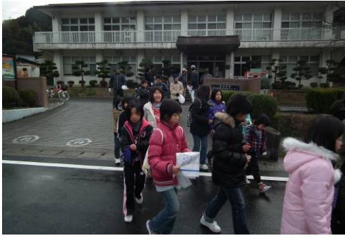
さっ、ゴミ拾いに出発!