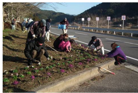
《小倉 国道320号沿い》 老若男女、色々な方々が植えていました