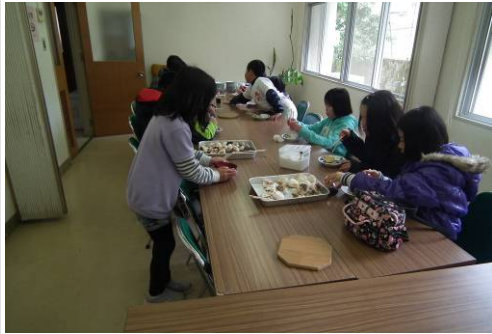
お餅は美味しかったかな?