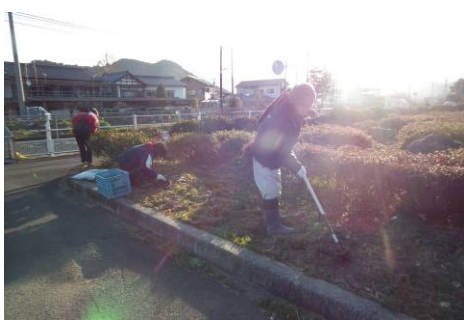
《出目1区 線路付近》 まずは花が植えられるように土をおこす事から

今年度の美化活動は終わりますが、来年度5月には直ぐに第1回目があります。地域の皆様のご協力をどうぞよろしくお願いいたします。