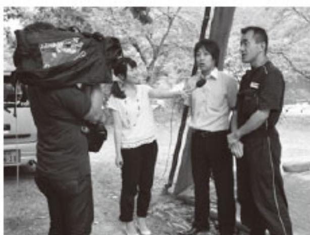
写真は取材を受ける卒業生