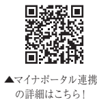
▲マイナポータル連携の詳細はこちら！

なります。 ※ID・パスワードをお持ちでない方は、税務署で職員による本人確認を行った後に発行されます(発行希望の方は、申告されるご本人が運転免許証などの本人確認書類をお持ちの上、税務署にお越しください。 なお、ID・パスワード方は暫定的な対応ですので、お早めにマイナンバーカードの取得をお願いします。 宇和島税務署 確定申告会場開設期間 2月16日(金)～3月15日(金) (土、日・祝日を除く) 受付時間 8時30分～16時 (相談開始は9時から) ※入場整理券の配布状況により午後4時前であっても受付を終了させていただく場合があります。