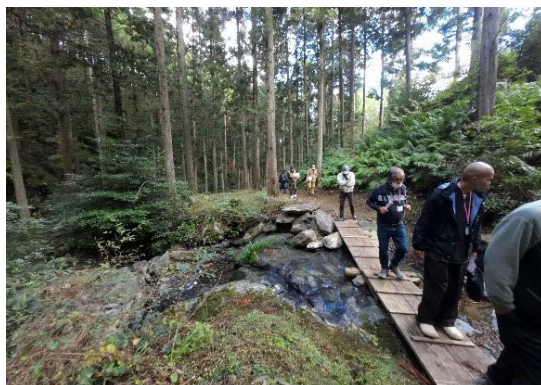
▲現地モニタリングの様子

現地を歩くたび、新たな発見があります。複数人の目で行う定期的なモニタリングは、見学者への満足度向上の基本と感じました。