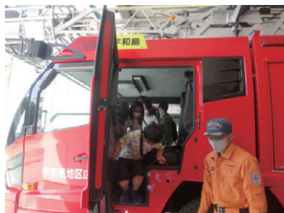
消防車や救急車に乗せてもらいました