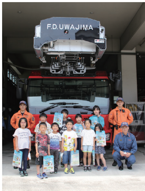
はしご車の前で消防士さんと記念撮影