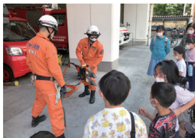
実演もしていただきました!