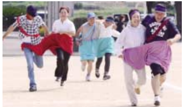
「デカパンでGO!」大きなパンツをはいて、力いっぱい走る選手

今年で9回目となった合同運動会には園児29人、児童48人、一般約400人の選手の皆さんが集い、それぞれの競技や踊りに汗を流しました。