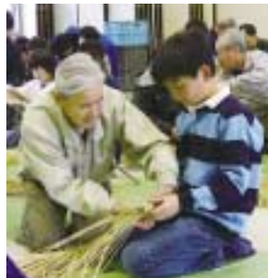
12/27 注連飾り作り お年寄りの手ほどきを受け、熱心に注連飾りを作る児童