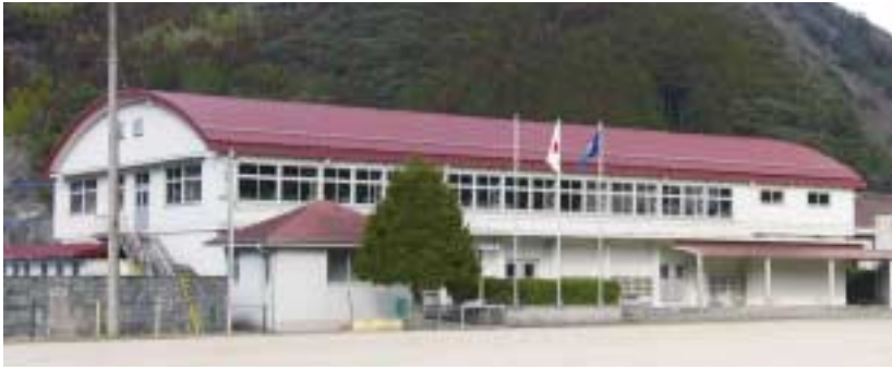
昭和60年に設置された掲揚台に国旗がはためく歴史にかおる体育館。平成7年には改修工事（倉庫の新設・床・天井照明器具・音響設備等）を施工。