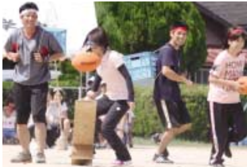
2人で息を合わせれば1回でクリアです。「ナイスシュート」の一場面