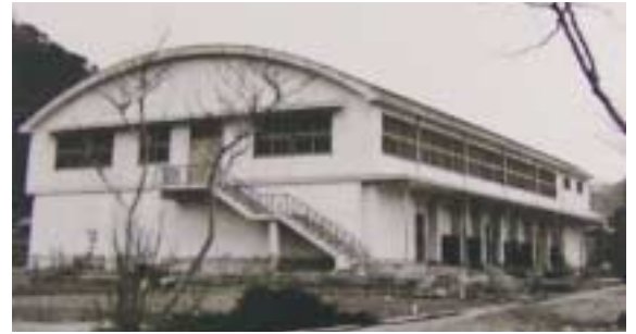
完成：昭和38年3月 構造：鉄骨鉄筋コンクリート造 瓦棒葺一部二階建 建築面積：延802.30平方メートル