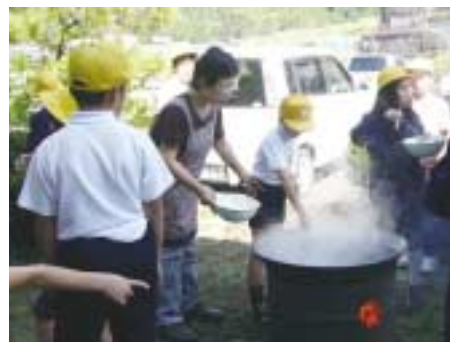
10/6 クロquette&おはぎ&いもたき会 美味しくいもたきを食べた後は、日頃の感謝を込めてお年寄りに肩たたきのプレゼントをしました。