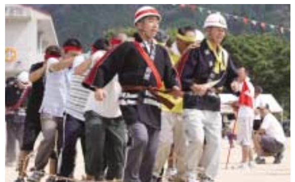
「消防団第4分団のむかで競争」5匹の大むかでがゴールを目指します。