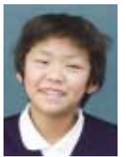
三島小学校 五年生

三島小学校の体育館は昭和38年3月に完成。以来48年の長い歳月を、小学校の行事は勿論、地域行事や室内スポーツを催す唯一の建物として「人と人を結び・その輪を広げる場所」という使命を果たしてきました。その体育館が今年の夏、「総検造りの体育館」として生まれ変わるべく建設が開始されます（完成予定は平成24年9月頃）。友達と運動したり遊んだりした、この体育館の思い出やエピソードを10代～60代の方に綴って頂きました。