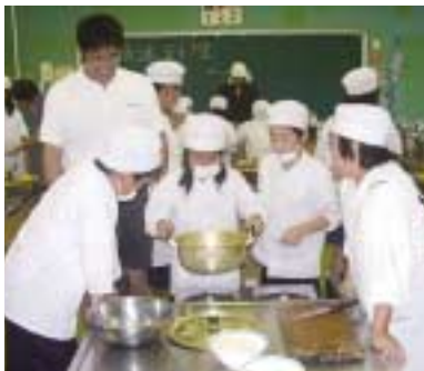
7/5 精進料理教室 「究極の健康料理」といわれる「精進料理」に挑戦しました。

老人クラブをはじめ、地域の方々にあたたかく見守られながら「三島の宝」として日々成長していく三島っ子。子ども達は学級の中で普段の生活ではできない作業を通して元気に遊び、学んでいます。 子どもを育て、その成長を見守ることは大変なことですが、それによりある大きな喜びや楽しみをもたらすものでもあります。子ども達が時代の変化に対応出来る心豊かで逞しく育っていくよう、地域全体で良い環境づくりをしていきましょう。