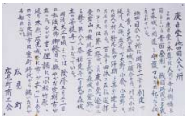
お堂の説明書きに、弘法大師御縁日には「市」が開かれ街道が賑やかだったと記されています。