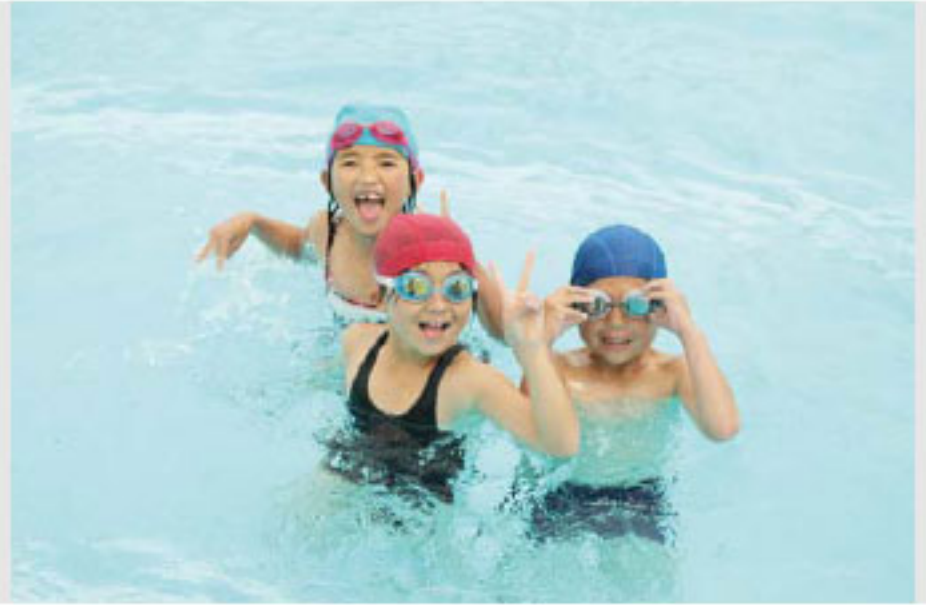
プール遊びを満喫する子どもたち

成川溪谷グリーンマーケットは5月6日、成川溪谷キャンプ場で開催され、雑貨店や飲食店など16店舗が出店しました。町内外の様々な作家の作品を展示・販売。訪れた人たちは、珍しい商品を手にとってみたり、出店者の説明に耳を傾けてみたりと、森の中で開催されるこのマーケットを満喫しているようでした。 成川溪谷グリーンマーケットは、10月末頃まで月の第4土曜日曜日に開催される予定です。