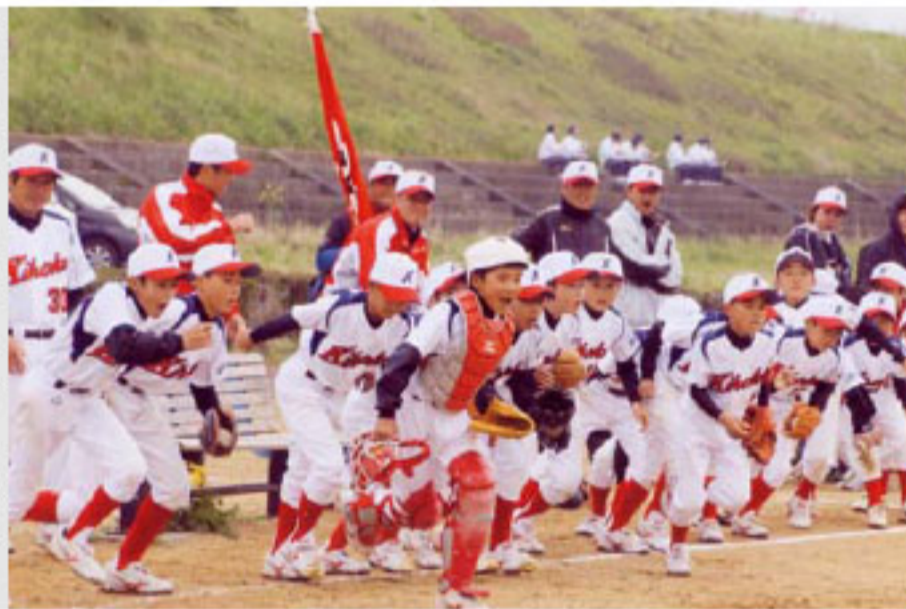
試合に臨む鬼北ジュニアの選手ら

4月29日、日吉夢産地で日吉夢産地グリーンフェスティバルが開催されました。特設ステージでは、日吉小学校児童による武左衛門太鼓の演奏、コーラスや親子デュオによる歌などが披露されました。ステージの合間には、町のゆるキャラも登場し、子どもたちは大喜び。会場では、地元有志らによる地元産の食材を使った料理などの販売も行われ、町内外から訪れた大勢の客で賑わいました。