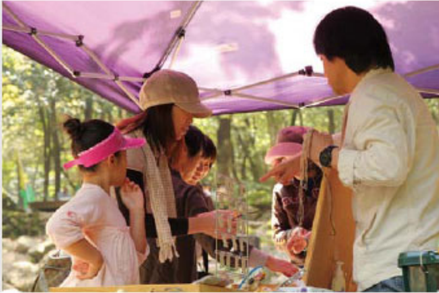
出店者の話に耳を傾ける来場客