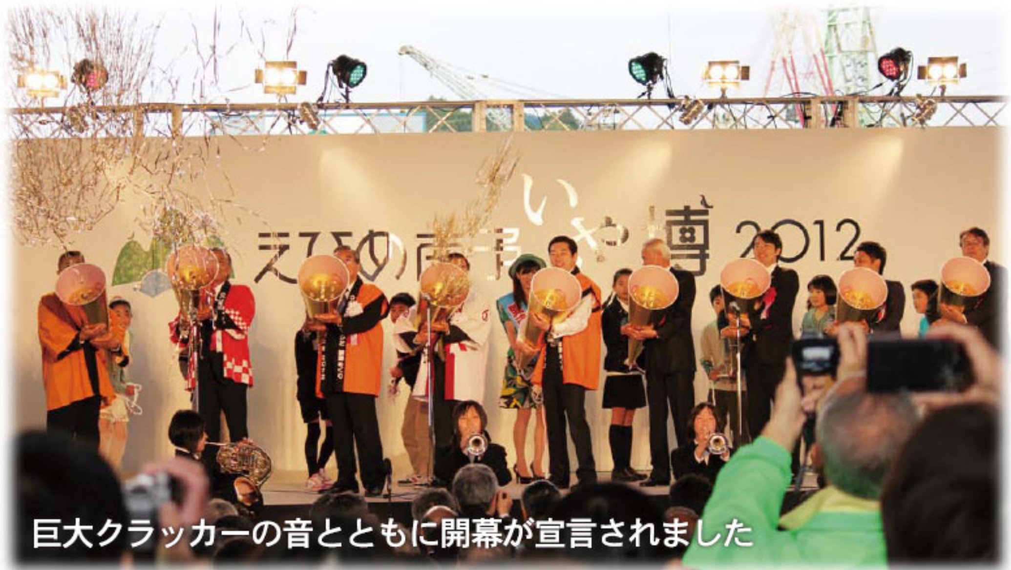
巨大クラッカーの音とともに開幕が宣言されました