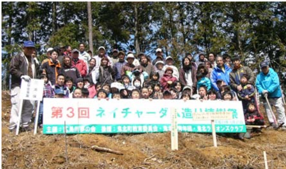
↑ 植樹をした全員の集合写真

御開山に登る途中では、頂上のほうが白くなっており、現場に着いた頃にも多少雪がちらつく寒い日でしたが、集まった人たちは主催者の挨拶終了後、早速、鍬やスコップを手に苗の植樹に取り掛かり、百数十本あった苗木も大勢の手によって、あっというまに植樹終了となりました。