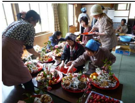
さまざまな料理が出来上がり、盛り付けに大忙しの様子