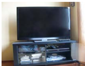
↑ 2階和室の42型液晶テレビとブルーレイディスクレコーダー