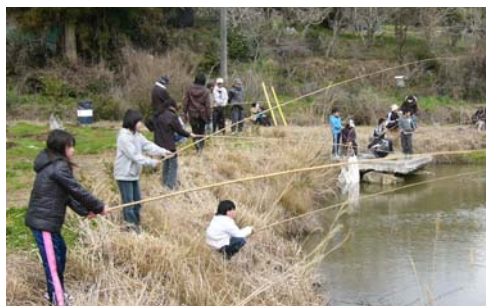
今年も大好評の鯉釣り大会、大物も釣れていました

昼食は、夢の会が用意した猪鍋やおにぎりで食事を取り、その後は今年初めての巣箱作りにも数名が指導を受けながら挑戦し完成にこぎつけました。