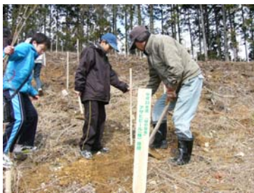
← 地元の人と共同作業で植樹