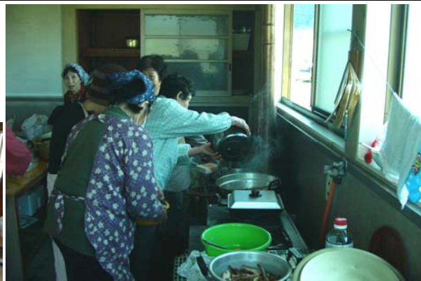
台所ではいい香りの中、ベテラン女性たちが、煮ものづくりに精を出されていました