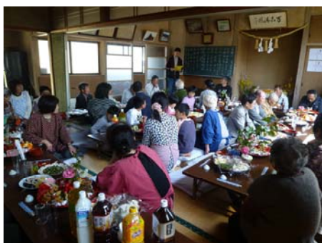
組内の家族が勢ぞろい準備も整い、花見ごもりの開始です