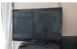
1階ロビーの46型プラズマテレビ

三島公民館では、県の「地域支え合い体制づくり事業」の補助を受け次のものを整備しました