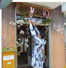
小野川公会堂入口に桜の花を飾って雰囲気を盛り上げています