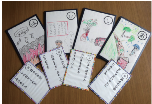
完成したかるたの一部

想定される災害に備え、楽しみながら災害や対策について学ぶことを目的に作成しました。