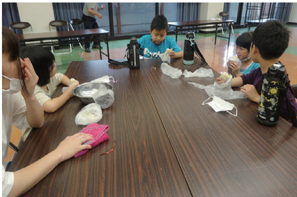
チョコやレーズンをトッピング しっとり系の蒸しパンが完成!