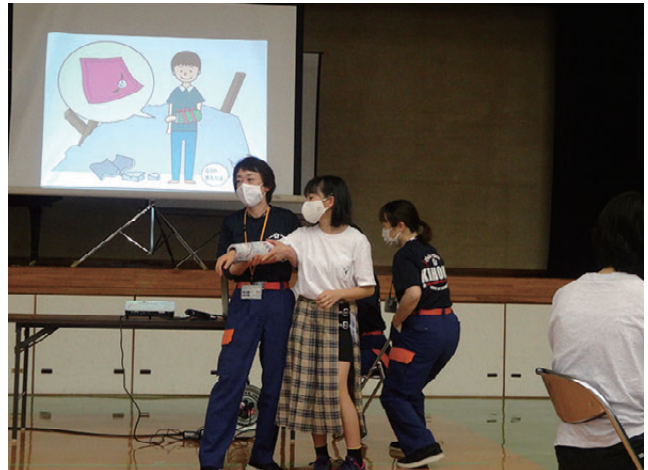
雑誌とストッキングを使って腕の固定