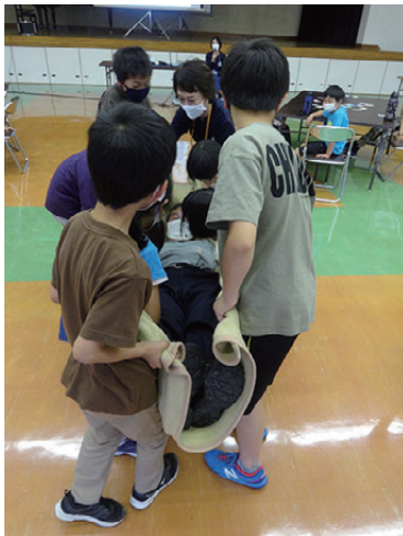
毛布の端を丸めて、簡易担架 みんなで協力して館長さんを運びました