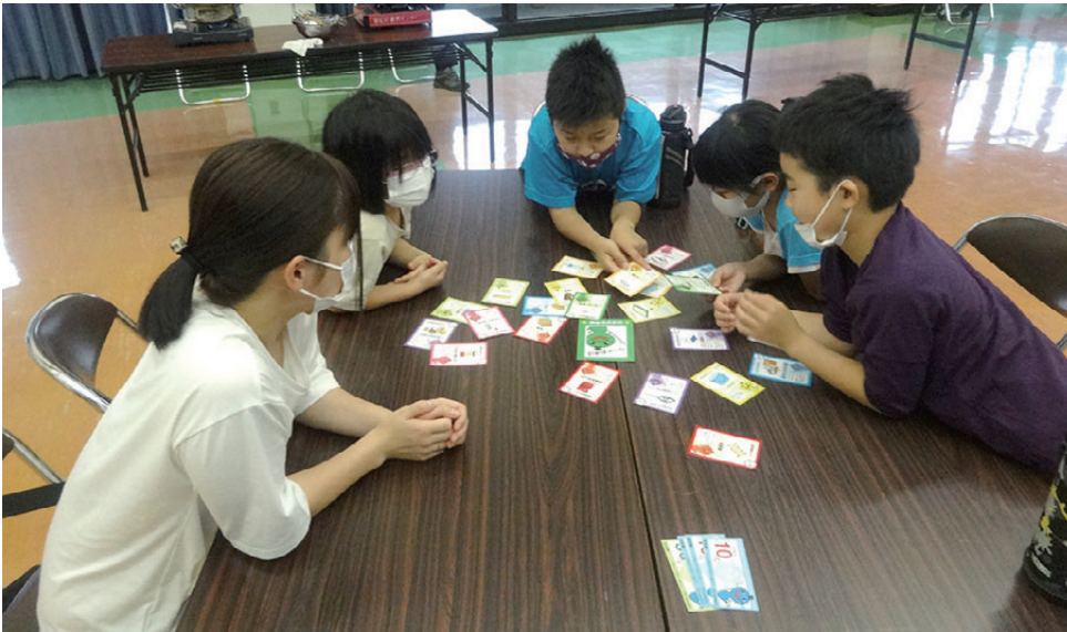
防災カードゲーム 学年に関係なく、それぞれが根拠を持つての意見あり！ 災害時は頼りになるねず

今年も元気いっぱいの日吉小学生たちと、日吉わんぱくスクールの開講しました。 わんぱくスクールは全学年対象ということもあり、まずは防災について興味を持ってもらうことを目的とし、簡単な講話と防災カードゲーム・手軽にできる防災クッキングを実施しました。 講師には、鬼北町消防団女性消防隊の方をお招きしました。『防災』『災害』等についての説明の後、梅雨時期ということと近年この時期に集中豪雨が多いことから、豪雨災害につ