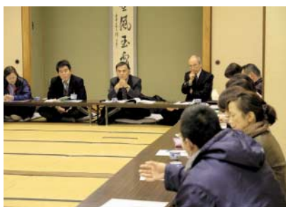
まちづくり懇談会の様子

この懇談会は▼開催日・場所▼運営・進行▼テーマ▼など、申込団体が主体となつて設定することになります。そのため、その団体の意向に沿った会にすることができま